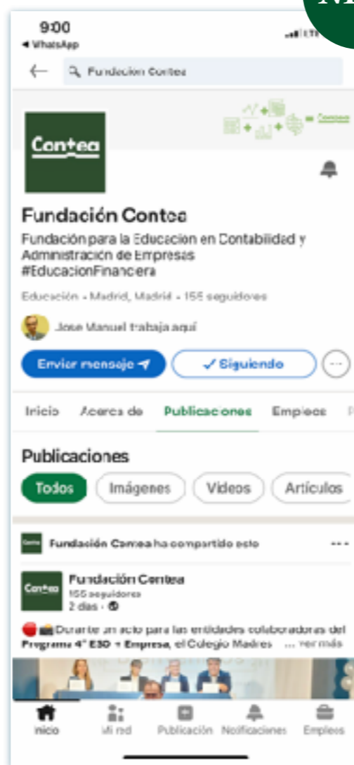
LinkedIn / @FundaciónContea