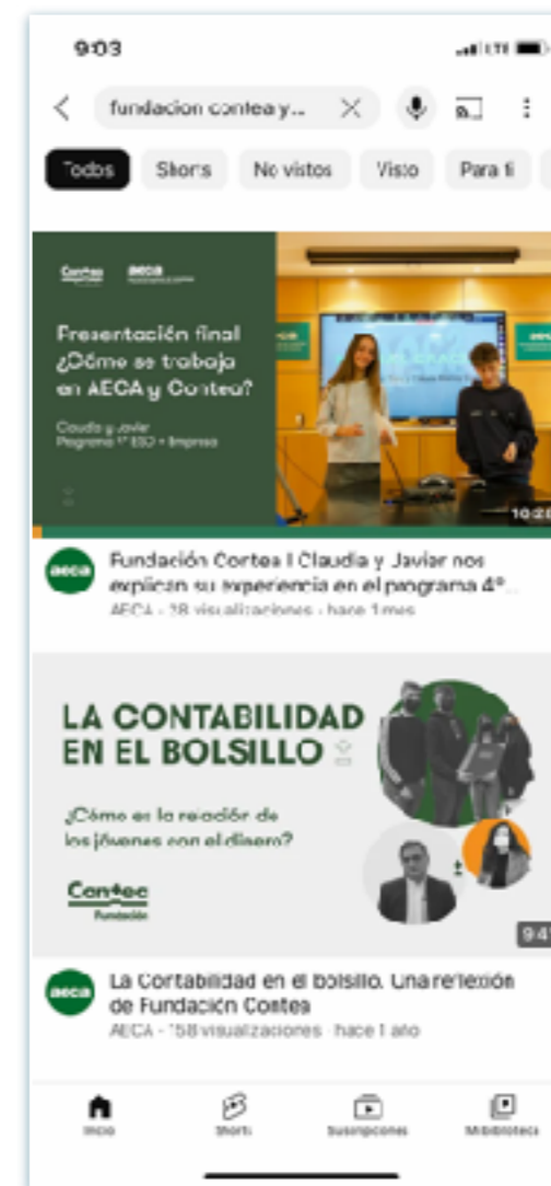
YouTube / Fundación Contea / AECA