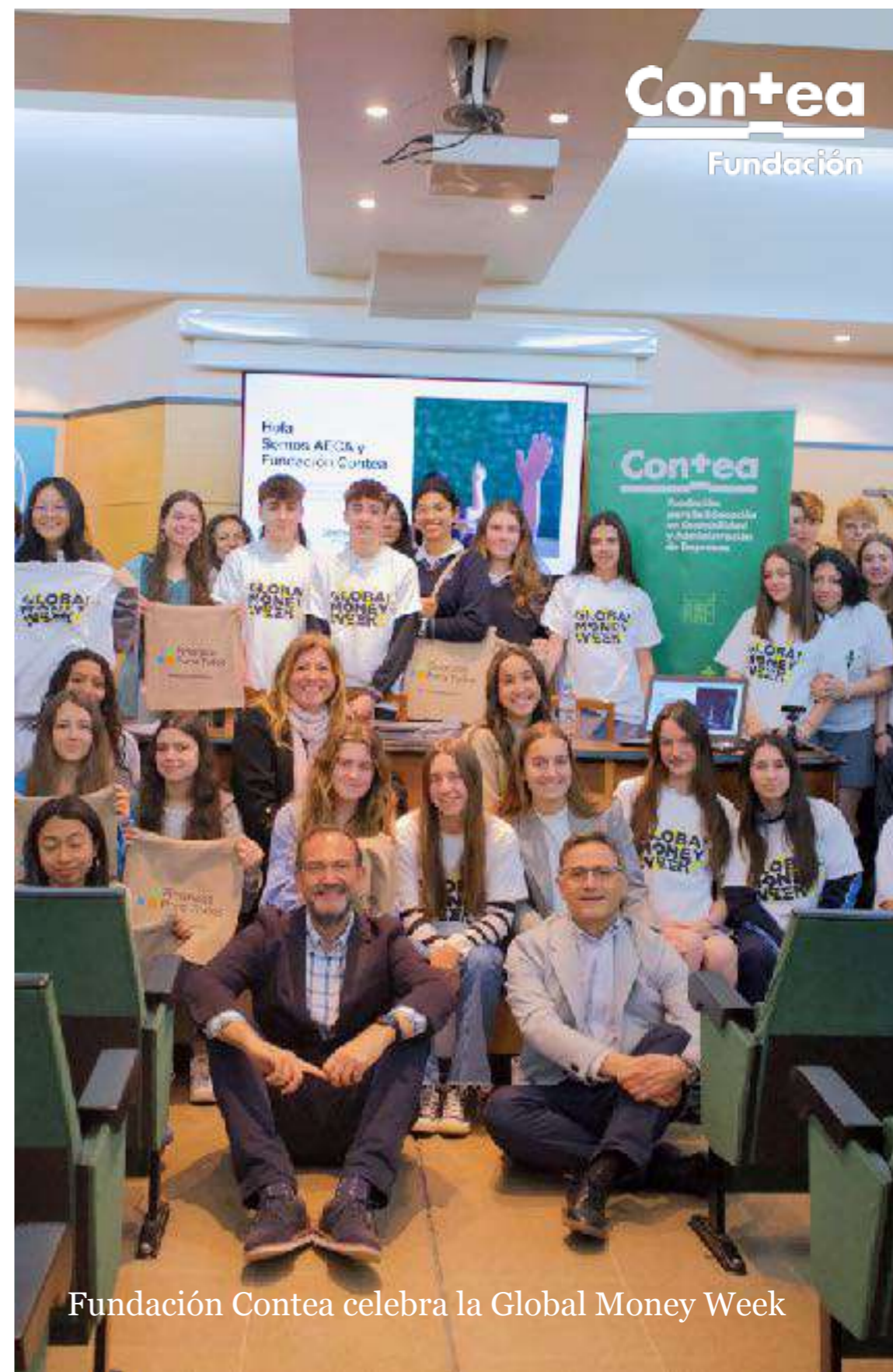
Fundación Contea celebra la Global Money Week